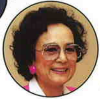
兼高かおる 旅行作家