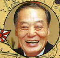
瓦力 防衛庁長官・衆議院議員 元建設大臣