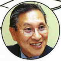
大賀典雄 ソニー株式会社社長